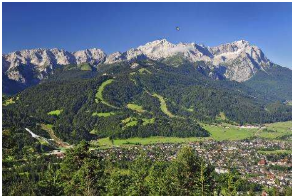
Eine Gästekarte, drei Destinationen rund um die Zugspitze.