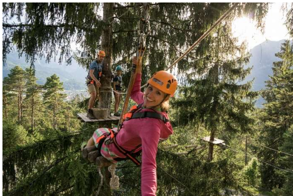
Mit der Gästekarte gibt es viele Ermäßigungen, z. B. für den Kletterwald in Garmisch-Partenkirchen.